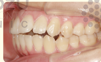
矯正治療後 リテーナー装着忘れにより 口ゴボになった症例

※当院の患者様で後戻りが起きた場合、再治療をご希望の方には特別再治療料金にて実施します。