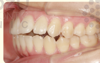
矯正治療後 リテーナー装着忘れにより 口ゴボになった症例

※当院の患者様で後戻りが起きた場合、再治療をご希望の方には特別再治療料金にて実施します。