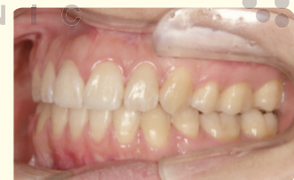
拔牙を併用した再治療を実施